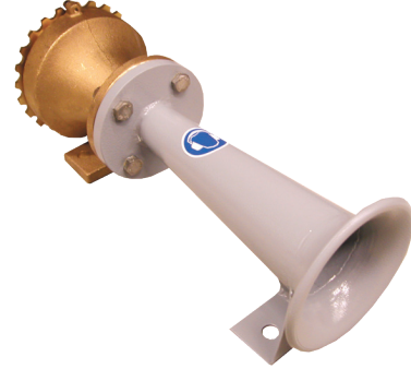
МАКРОФОН M125/320 RV

Диапазон рабочих температур: от -25° до +60°, с установленным нагревательным элементом рупора до - 60°